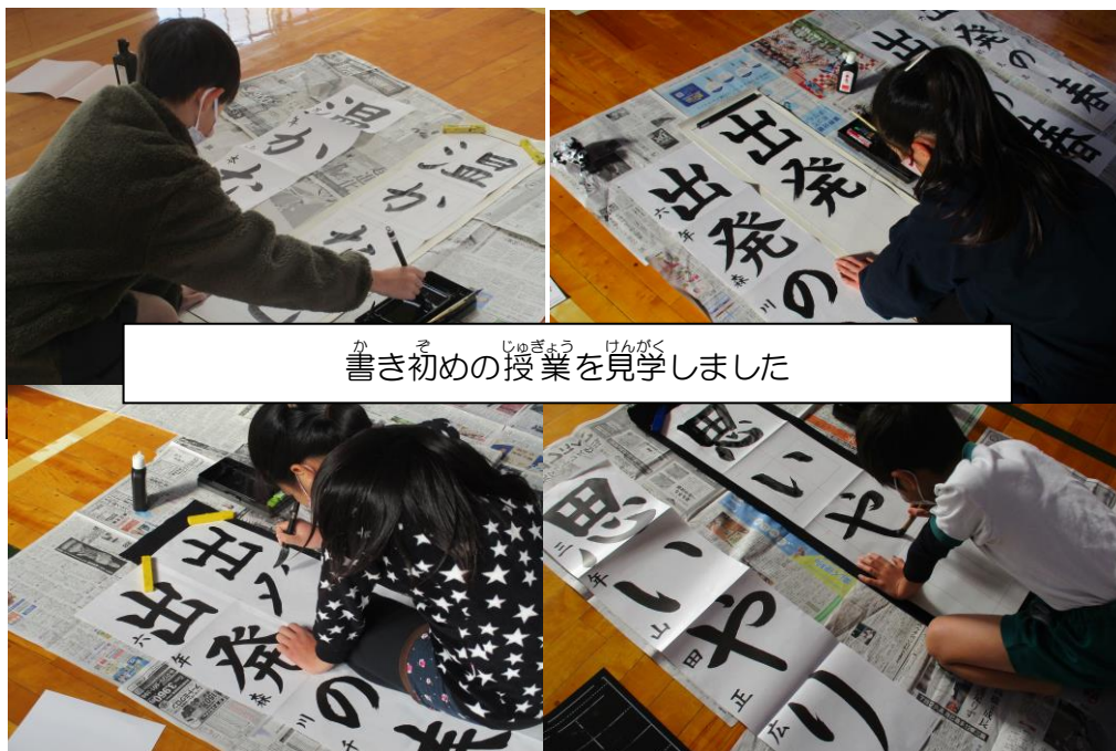
書き初めの授業を見学しました